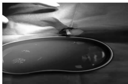
图 4 导尿治疗