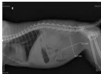
图2 侧位 DR 影像