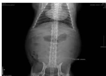
图1 正位 DR 影像

丸子,蓝猫,雄性,4岁11个月,体重4.2 kg,未绝育,常规免疫完成。主诉:患猫近期食欲不振,精神沉郁,排尿困难,具体表现排尿时间延长,开始有尿淋漓的表现,近两天突然无尿,腹围增大,故前来就诊。临床检查:体温 38.1 °C,心率 122 次/min,呼吸 36 次/min, CRT < 1s,精神不佳,腹围明显膨大,患猫偶尔舔舐外生殖器周围,腹壁触诊紧张,膀胱区充盈。血液常规检查白细胞和中性粒细胞高于参考值。X射线检查膀胱充盈,未见结石(图1、图2)。