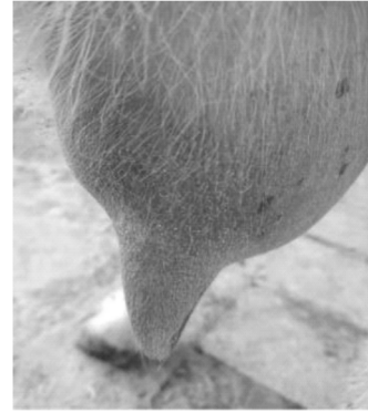
图 2 坏死性乳房炎临床症状图