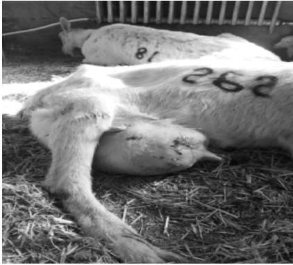
图 1 慢性乳房炎临床症状