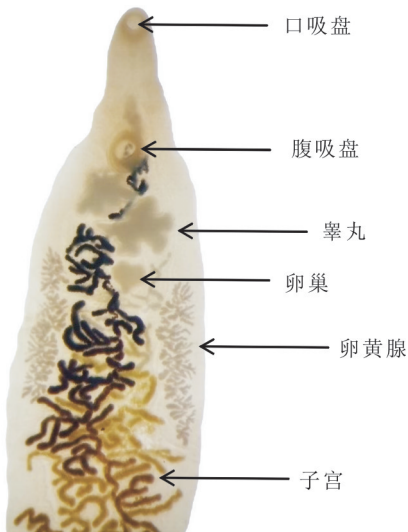
图 1 中华双腔吸虫内部结构