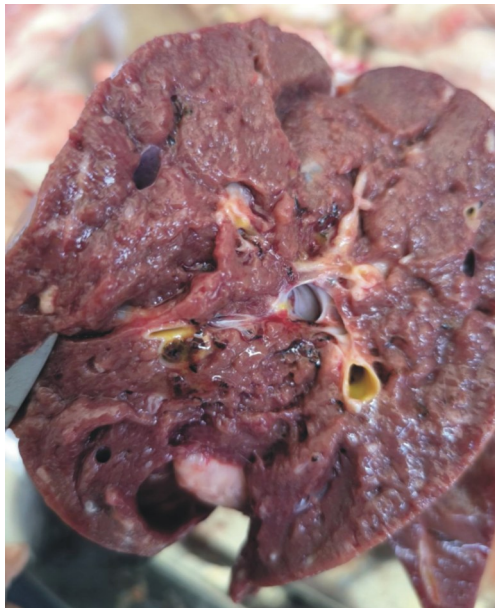
图 2 中华双腔吸虫引起的肝脏病变