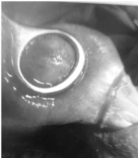
图 1 环状钳把阴道牵引出体外

除。如果肿瘤巨大不能通过阴道口进行切除时,又不具备微创手术条件下,可采用腹背侧切开暴露瘤体切除,方法可行,效果良好。