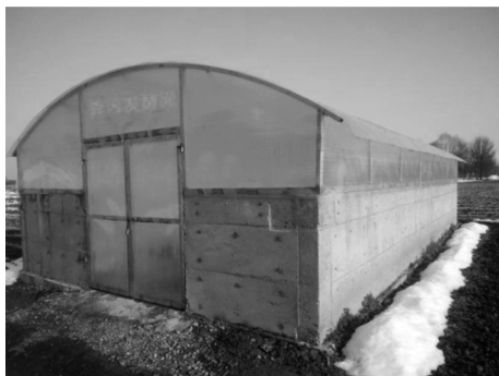
图 1 粪污发酵间

牛床硬化及粪尿沟制作之前,在食槽排水阀与最近尿液沉降池之间、底于粪尿沟沟底 10 cm 地下以及尿液沉降池于圈舍外污水收集池之间预埋直径 150 cm PVC 材质下水管。牛床与清粪道之间制作粪尿沟,宽 40 cm,深 3~5 cm,尿液沉降池之间中心点沟底分别向两边尿液沉降池呈 1% 下坡度,中心