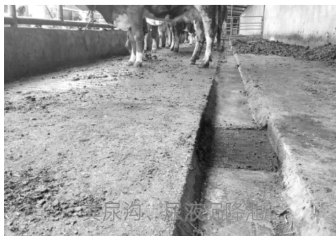
图 2 粪尿沟、尿液沉降池

粪尿沟每 9 m 建一尿液沉降池,长 60 cm,宽 35 cm,深 60 cm,池边池底水泥收光,尿液沉降池之间用预埋 PVC 管形成串连连接。池口用 2.5cm 角铁做四边,用 1 cm 厚的钢板打孔(孔径 0.8 cm,孔距 2.5 cm)做活动篦子池盖,距圈舍清粪门最近污水沉降池通向圈舍外污水收集池。(如图 2、图 3 所示)